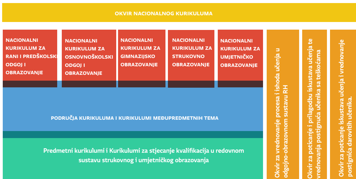
Slika A. Sustav nacionalnih kurikulumskih dokumenata izrađenih u okviru Cjelovite kurikularne reforme

Pred Vama se nalazi prijedlog nacionalnog kurikuluma međupredmetne teme Održivi razvoj . Okvir nacionalnog kurikuluma (ONK) određuje sustav nacionalnih kurikulumskih dokumenata , kojima se na nacionalnoj razini iskazuju namjere povezane sa svrhom, ciljevima, očekivanjima, ishodima, iskustvima djece i mladih osoba, s organizacijom odgojno-obrazovnog procesa i s vrednovanjem. Međupredmetne teme izrazito su važan dio odgoja i obrazovanja u Republici Hrvatskoj. Sustav nacionalnih kurikulumskih dokumenata prikazan je na Slici A.