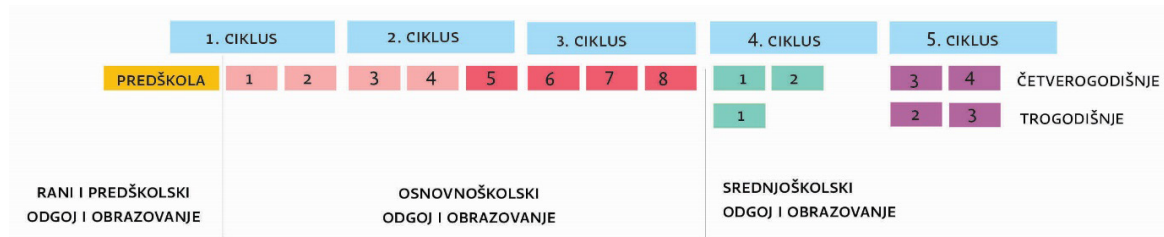
Slika B. Odgojno-obrazovni ciklusi u postojećoj strukturi dovisokoškolskoga odgoja i obrazovanja (ONK, 2016.) u okviru Cjelovite kurikularne reforme

ONK-om su određeni i odgojno-obrazovni ciklusi koji obuhvaćaju nekoliko godina učenja i poučavanja, a usklađeni su s ciljevima kurikulumu i razvojnom dobi djece i mladih osoba. Određivanje odgojno-obrazovnih ciklusa omogućuje cjelovitije zahvaćanje razvoja učenika, uvažavajući razlike u njihovim sposobnostima i razvojnim putovima. Posebno su važni u procesu kurikulumskog planiranja i programiranja. Na Slici B prikazani su odgojno-obrazovni ciklusi u osnovnoškolskom i srednjoškolskom odgoju i obrazovanju.