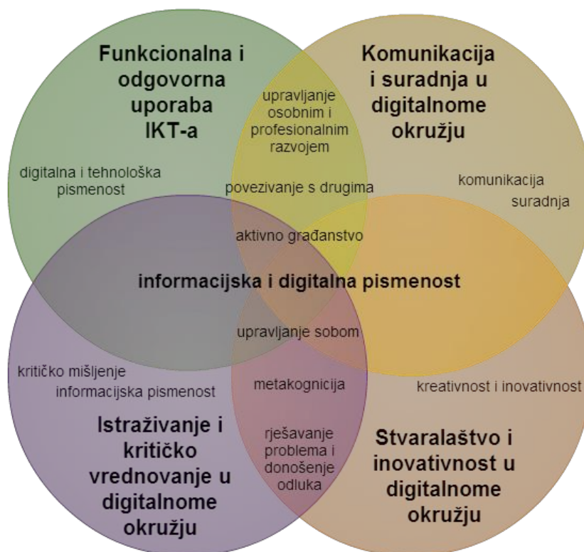
Grafički prikaz: Uporaba informacijske i komunikacijske tehnologije i generičke kompetencije

Osobito se preporučuje poticati uključivanje učenika iz osnovne i srednje škole u različite školske, lokalne, nacionalne i međunarodne projekte koji se odvijaju u virtualnome okružju, a u kojima će biti formirane heterogene skupine učenika (različite dobi, prethodnih iskustava učenja, interesa i sl.). Na taj će se način učenike vertikalno povezivati sukladno njihovim interesima.