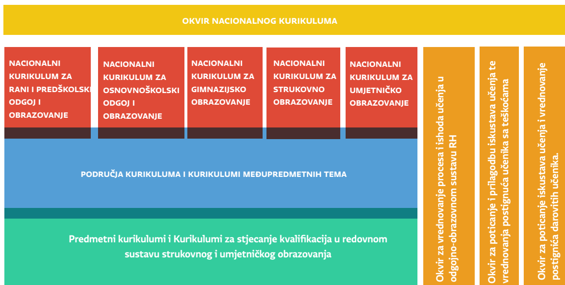
Slika A. Sustav nacionalnih kurikulumskih dokumenata izrađenih u okviru Cjelovite kurikularne reforme

Pred Vama se nalazi prijedlog nacionalnog kurikulumu međupredmetne teme Upotreba informacijske i komunikacijske tehnologije. Okvir nacionalnog kurikulumu (ONK) određuje sustav nacionalnih kurikulumskih dokumenata , kojima se na nacionalnoj razini iskazuju namjere povezane sa svrhom, ciljevima, očekivanjima, ishodima, iskustvima djece i mladih osoba, s organizacijom odgojno-obrazovnog procesa i s vrednovanjem. Međupredmetne teme izrazito su važan dio odgoja i obrazovanja u Republici Hrvatskoj. Sustav nacionalnih kurikulumskih dokumenata prikazan je na Slici A.