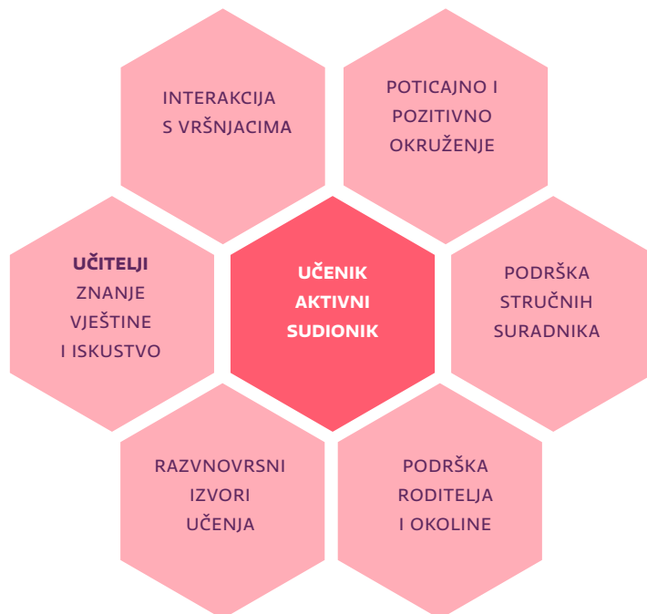
Slika 2. Ključne odrednice odgojno-obrazovnog procesa

Osnovu učenja čini proces kojim učenik aktivno konstruira i nadograđuje svoja znanja i vještine, ali i oblikuje vrijednosti. U procesu poučavanja učenicima se aktivnim sudjelovanjem u učenju i preuzimanjem odgovornosti za proces učenja omogućava razvoj kompetencija, razvoj strategija učenja i osobni razvoj.